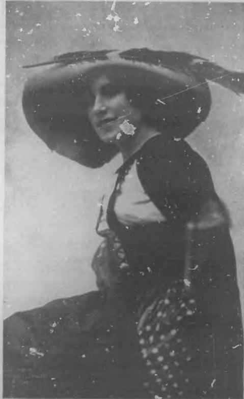
LUCRECIA BORI.—Tiple lírica.

La primera es en realidad notabilísima por que reúne todas las condiciones apetecibles é imaginables para ocupar un lugar tan elevado en el mundo del arte, que pocas son en la actualidad las que