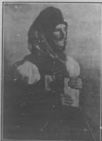
Del valle de Ansot en el Alto Aragón.—Cuadro de la Srta. Ariza.