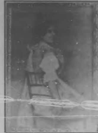
Valenciana.—Por la Srta. Ariza