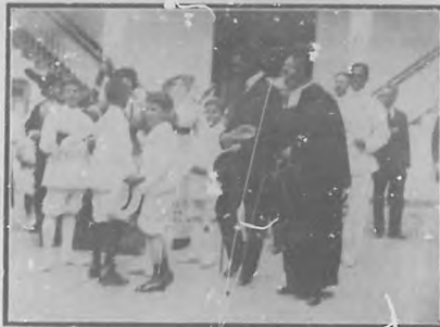
EN EL COLEGIO LA SALLE - Un aspecto del acto. - Los niños bautizados.

tario particular señor Comallonga, y otras personalidades oficiales y nutrida representación de la prensa. El acto fué solemne, pronunciándose elocuentes discursos alusivos al acto y a la importancia de la Granja. Los concurrentes fueron luego obsequiados con un banquete y otros festejos.