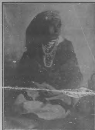
Niña segoviana.—Cuadro de la Srta. Ariza