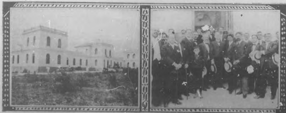
COLON - Inauguración de la Granja Escolar de Colón. - El edificio. - Aurores y concurrentes al acto.

La segunda parte, el fraternal almuerzo a nuestros compañeros de la prensa diaria y periódica, se celebrará hoy, domingo, en Miramar y en el mismo sitio que debía celebrarse el concierto nocturno que no se ha suspendido, y si solamente se ha aplazado. Por cierto que, dado el número de palcos vendidos y la gran concurrencia que a pesar de la mala noche acudió a Miramar, creyendo que se llevaba a efecto el concierto, no